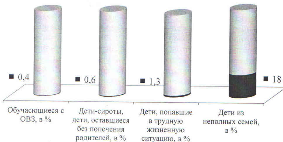
Рис. 1. Социальные характеристики контингента обучающихся.

Основной контингент обучающихся проживает в Краснофлотском районе г. Хабаровска. Социальный паспорт свидетельствует о неоднородности состава семей, о наличии социально-незащищенных семей: