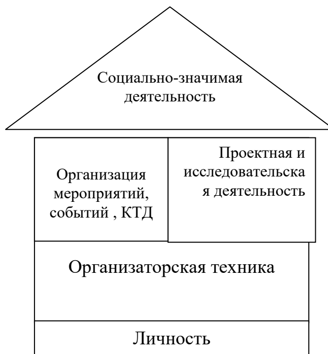
Схема реализации программы

Фундамент – Осознание себя как личности (1-ый год обучения 1-12 занятия)